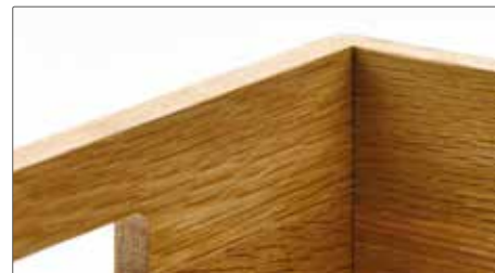
Licht eikenhout, doorschijnend gelakt