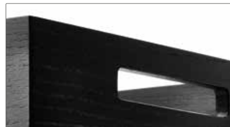
Es zwart, gelakt